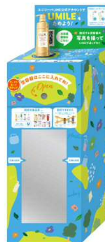
「FUMILE (ユーマイル)」回収ボックス

住所：さいたま市中央区新中里 3-20-30 ボックス設置場所：店頭入口付近 営業時間：午前10時～午後8時