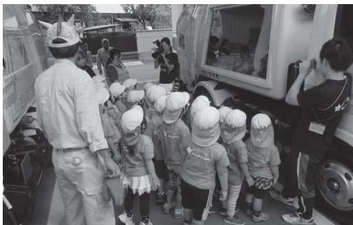
▲内部が見えるスケルトンパッカー車で、ごみの収集実演(ごみスクール)

保育園・幼稚園などの未就学児と小学4年生を対象に、ごみの分別や資源の大切さなどを伝えています。