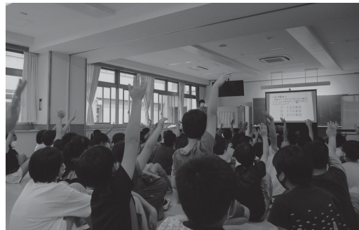
▲授業の様子(小学校水道教室)

社会科の授業で水道について学ぶ小学4年生を対象に、水と環境などの講話を行っています。