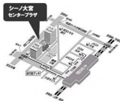
大宮駅西口徒歩8分

【日程・内容】 申し込みは不要です。途中回からの参加や、興味がある回だけの参加も歓迎です。