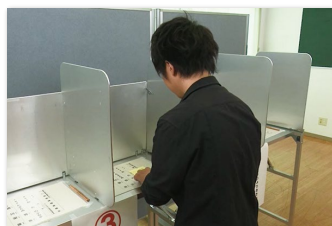
② はじめての選挙 ～投票って意外とカンタン!～