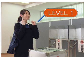
① Level up! あなたも素敵な大人!