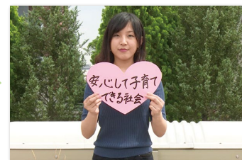
③ 私たちの願いを託す一票 ～届けようあなたの声～