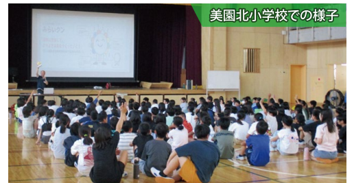
美園北小学校での様子