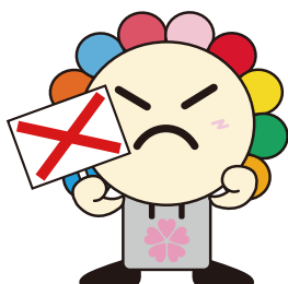
さいたま市選挙キャラクター みらいくん