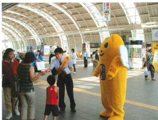
▲ さいたま新都心駅での啓発活動