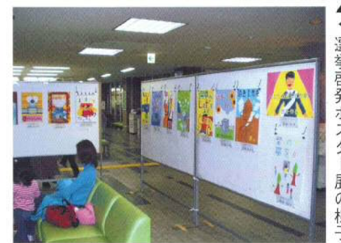
▲中央区役所での選挙啓発ポスター展の様子