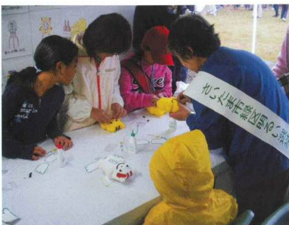
▲ 秋の区民まつりでのめいすいくん人形作り風景