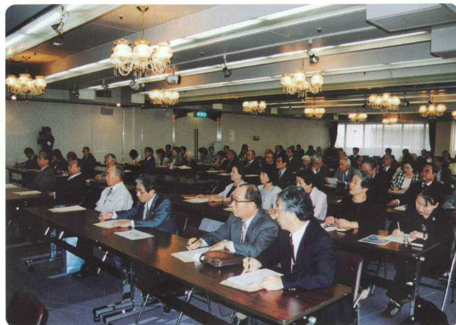
▲さいたま市明るい選挙推進協議会設立記念講演会