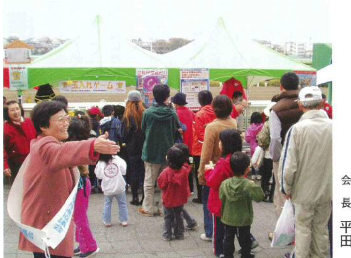
▲ 南区ふるさとふれあいフェアでの啓発活動 大盛況だった「玉入れゲーム」