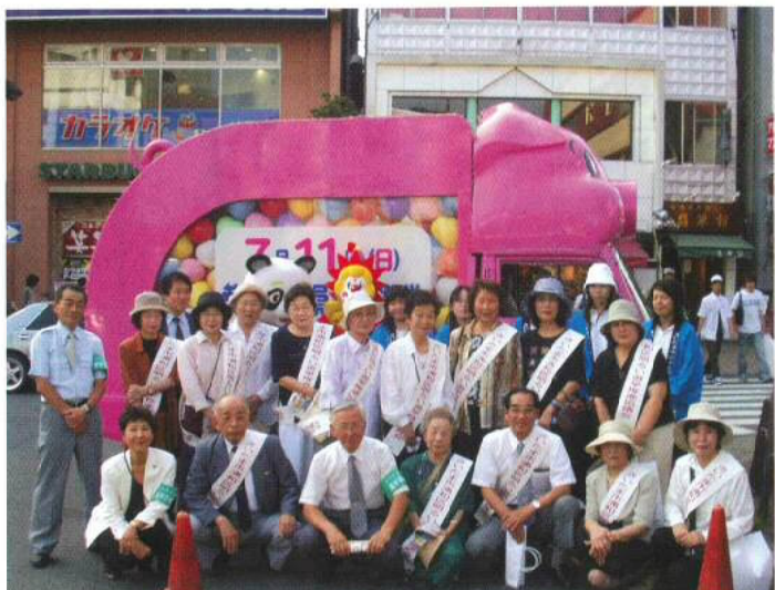
▲ 北浦和駅での啓発活動