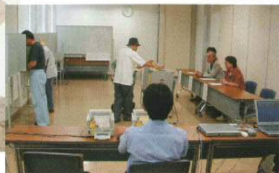
▼ 期日前投票所で投票管理者・立会人を務める