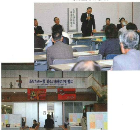
▲ 啓発横断幕の掲出