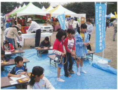
▲ ふれあいまつり(子供に大人気のめいすいくんぬりえ)

平成17年度は市長選挙の年となりますが、引き続き推進員の皆様のご協力のもと、地域の投票率アップを願って様々な啓発活動を実施してまいります。たいと考えております。