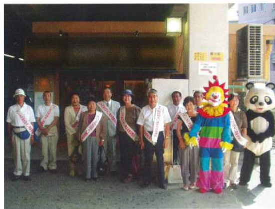
▲ 西浦和駅での啓発活動