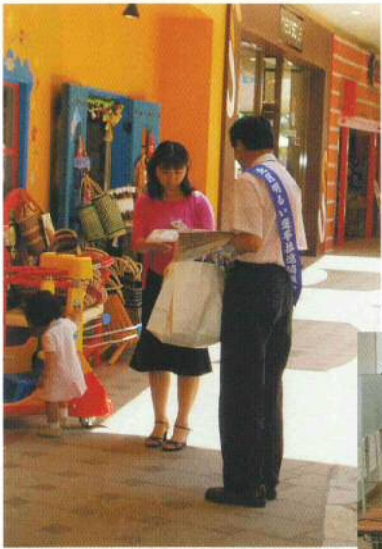
▲ ステラタウンでの啓発活動