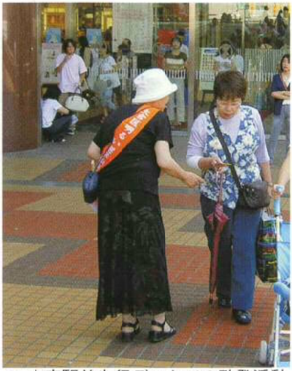
▲ 大宮駅前歩行デッキでの啓発活動