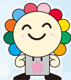
さいたま市選挙キャラクター みらいくん

第14号まで発行してきました、さいたま市の選挙啓発事業広報紙「明るい選挙推進協議会たより」は、今回から「さいたま市明るい選挙推進協議会」と「さいたま市選挙管理委員会」の協働事業による「明るい選挙推進たより」として発行することになりました。