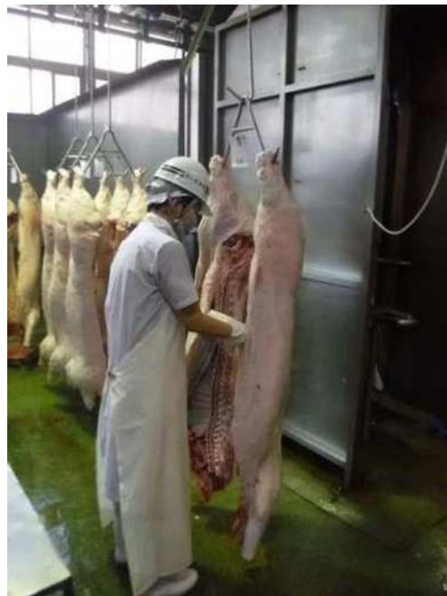
豚枝肉検査の様子