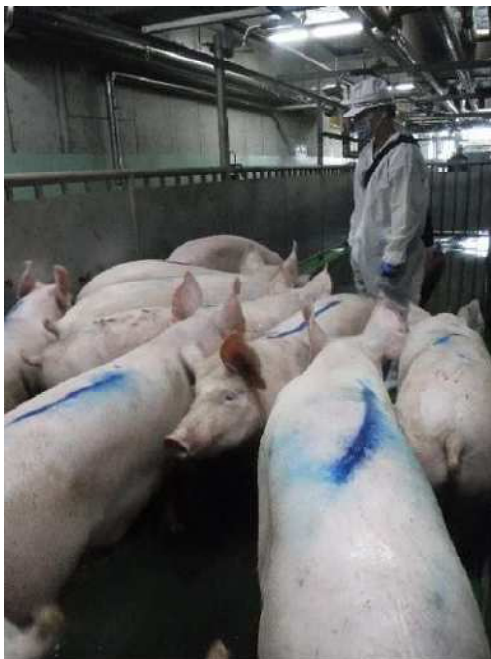
豚生体検査の様子

牛については、特定危険部位（SRM）の確実な除去の確認及び国の通知に基づくBSEスクリーニング検査 ※24 を必要に応じて実施します。