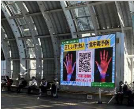
さいたま新都心駅前大型映像装置