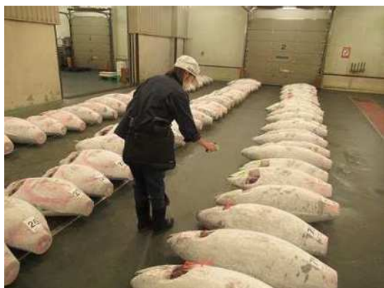
マグロ取扱い施設監視の様子

※上記の表は最低限の頻度を示したものであり、個別の対象施設の衛生管理状況に応じ、頻度を引き上げるなど適切な監視指導を実施することとしています。