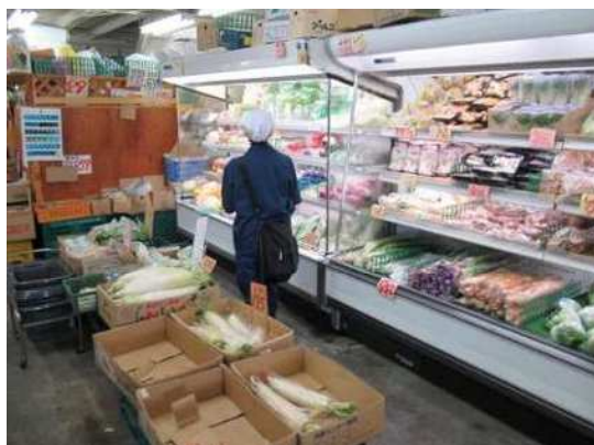
食料品販売施設監視の様子