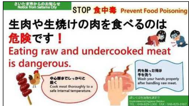
啓発用電子データ（英語対応）