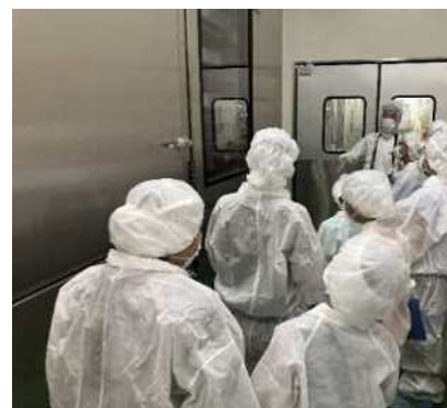
みんなで学ぼう！食品衛生

低年齢層を含めた消費者が食品衛生業務を学べる体験型イベント（12組24名程度）を実施し食の安全に関する知識の普及を図ります。