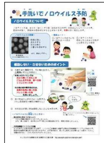
啓発資料「手洗いでノロウイルス予防」

ノロウイルスによる食中毒や感染症に対する正しい知識の習得と調理従事者による二次感染を未然に防止することを目的に、市内の福祉施設や学校等にノロウイルスに関する啓発用電子データを配信するとともに、消費者への街頭キャンペーンを実施し、知識の普及啓発を図ります。