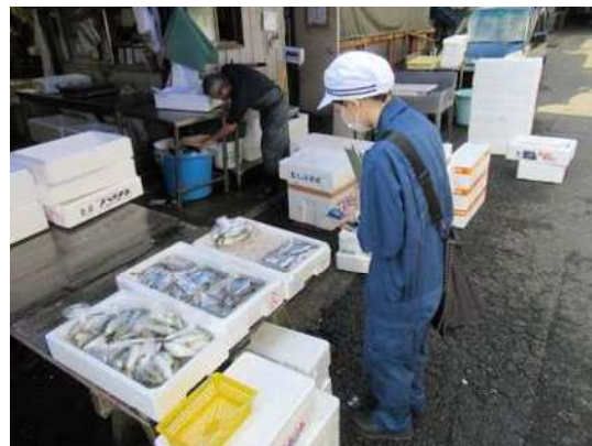
魚介類販売施設監視の様子