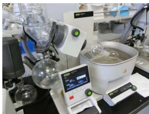
理化学検査の様子