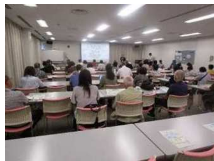
食の安全フォーラム

食の安全に関する講演会等を年3回程度開催し、食の安全に関する知識の普及を図ります。また、消費者や食の安全に関係する団体及び食品等事業者などとの意見交換を積極的に行います。