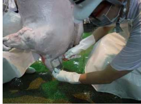
豚枝肉微生物検査（採材）の様子

と畜場、食肉市場及び食鳥処理施設において、HACCPに基づいた衛生管理が適切に行われているかを含め、食肉や施設設備等の衛生管理状況を把握し科学的根拠のある監視指導を行うため、以下の検査を実施します。