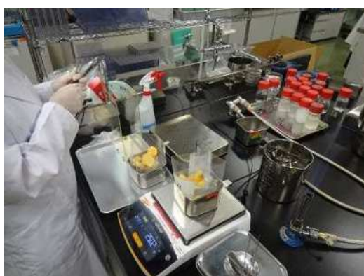
微生物検査の様子

市内を流通する食品について、放射性物質が基準値を超えて含まれていないか確認します。