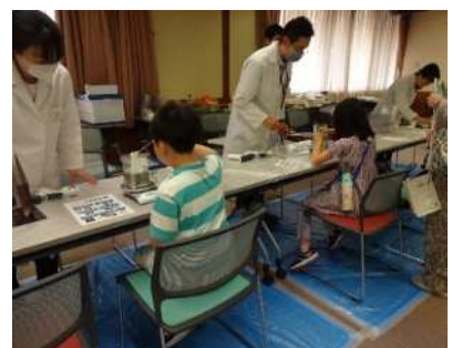
サイエンスラボの様子

食品衛生に関する最新の情報・知識を提供し、飲食店をはじめとする食品等事業者や、食品に関係する高齢者介護施設従事者などの資質の向上を図るため、依頼に応じて講習会（20～100名程度）を実施します。