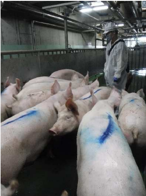
豚生体検査の様子

牛については、特定危険部位（SRM）の確実な除去の確認及び国の通知に基づく B S E スクリーニング検査※ 2-5-4 を必要に応じて実施します。