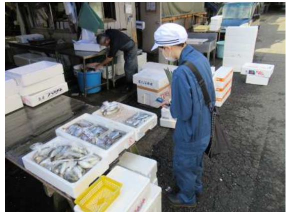
魚介類販売施設監視の様子