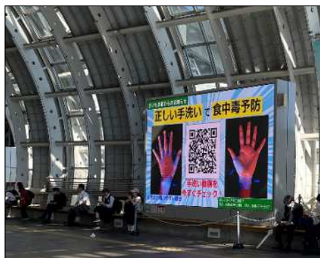
さいたま新都心駅前大型映像装置