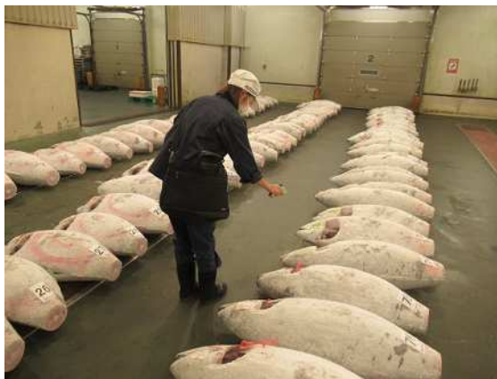
マグロ取扱い施設監視の様子

※上記の表は最低限の頻度を示したものであり、個別の対象施設の衛生管理状況に応じ、頻度を引き上げるなど適切な監視指導を実施することとしています。