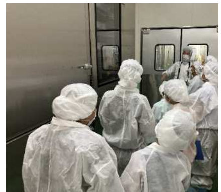
「みんなで学ぼう！食品衛生」の開催

低年齢層を含めた消費者が食品衛生業務を学べる体験型イベント（1240組2420名程度）を実施し食の安全に関する知識の普及を図ります。