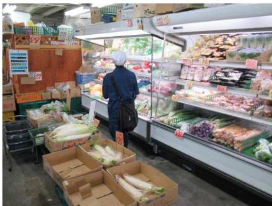
食料品販売施設監視の様子