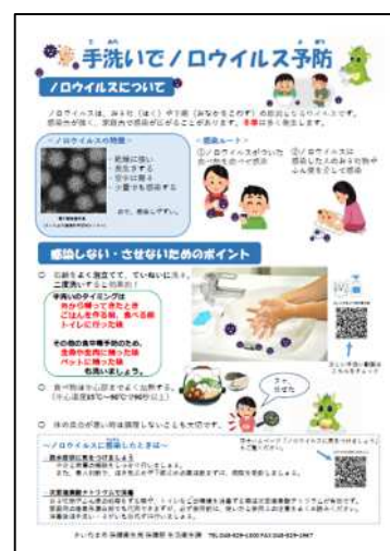
啓発資料「お肉はよく焼いて食べよう手洗」

ノロウイルスによる食中毒や感染症に対する正しい知識の習得と調理従事者による二次感染を未然に防止することを目的に、市内の福祉施設や学校等にノロウイルスに関する啓発用電子データを配信するとともに、消費者への街頭キャンペーンを実施し、知識の普及啓発を図ります。