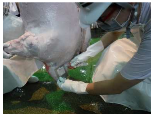
豚牛枝肉微生物検査（採材）の様子

と畜場、食肉市場及び食鳥処理施設において、HACCPに基づいた衛生管理が適切に行われているかを含め、食肉や施設設備等の衛生管理状況を把握し科学的根拠のある監視指導を行うため、以下の検査を実施します。