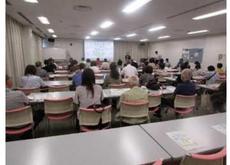
食の安全フォーラム

食の安全に関する講演会等を年3回程度開催し、食の安全に関する知識の普及を図ります。また、消費者や食の安全に関係する団体及び食品等事業者などとの意見交換を積極的に行います。