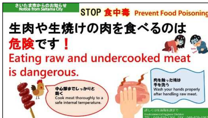
啓発用電子データ（ジャガイモによる食中毒英）