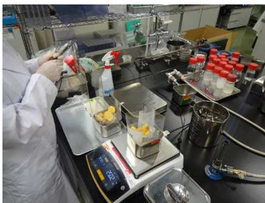
微生物検査の様子

市内を流通する食品について、放射性物質が基準値を超えて含まれていないか確認します。