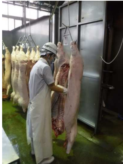
豚枝肉検査の様子