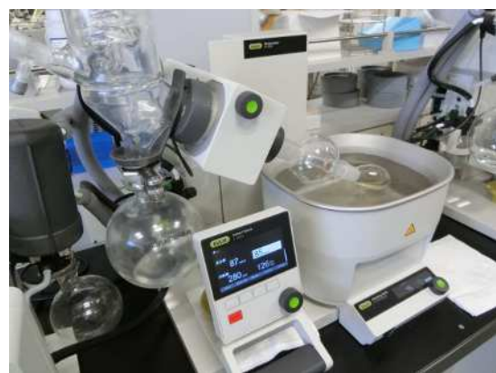
理化学検査の様子