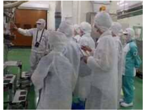
一日食品衛生監視員 工場内監視の様子

低年齢層を含めた消費者が食品衛生監視業務を体験できるイベント（10組20名程度）を実施し食の安全に関する知識の普及を図ります。