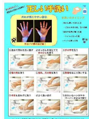
啓発資料「正しい手洗い」