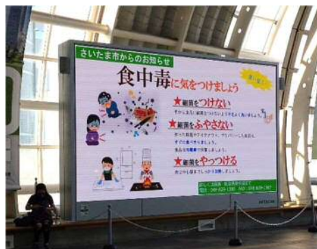
さいたま新都心駅駅前大型映像での啓発

ノロウイルスによる食中毒や感染症に対する正しい知識の習得と調理従事者による二次感染を未然に防止することを目的に、市内の福祉施設や学校等にノロウイルスに関する啓発用電子データを配信するとともに、消費者への街頭キャンペーンを実施し、知識の普及啓発を図ります。