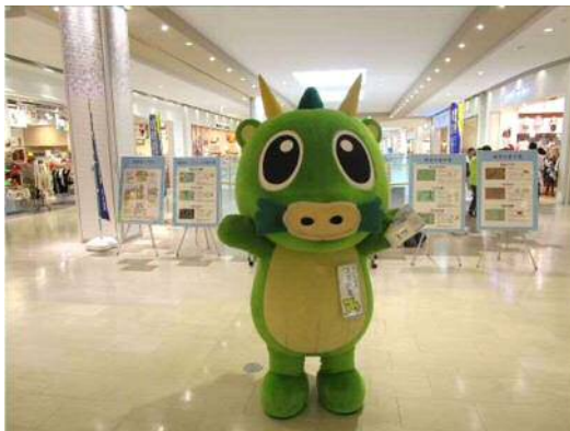
街頭キャンペーンの様子

ノロウイルスによる食中毒や感染症に対する正しい知識の習得と調理従事者による二次感染を未然に防止することを目的に、市内の福祉施設や学校等にノロウイルスに関するリーフレットの配布や研修会を開催するとともに、消費者への街頭キャンペーンを実施し、知識の普及啓発を図ります。