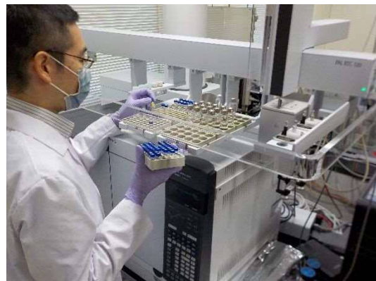
理化学検査の様子