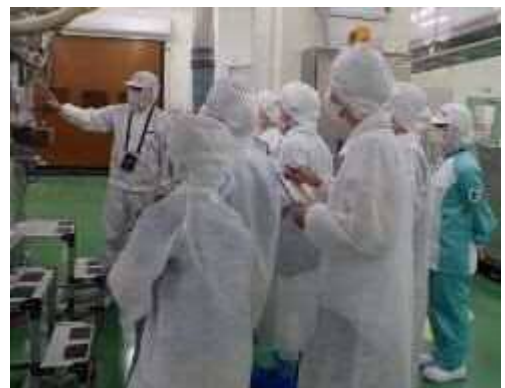
一日食品衛生監視員 工場内監視の様子