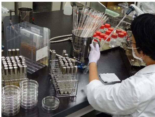
微生物検査の様子

食品に含まれる放射性物質に対する安全性の確保及び消費者の不安を払拭するため、市内を流通する食品に含まれる放射性物質が基準値を超えていないか確認します。