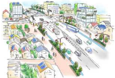
都市の機能強化を図る道路 ※基本方針1・2の整備イメージです。 ※10年後の4車線道路のイメージです。