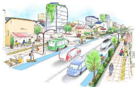
安全・安心な都市生活に資する道路 ※基本方針3の整備イメージです。 ※10年後の2車線道路のイメージです。