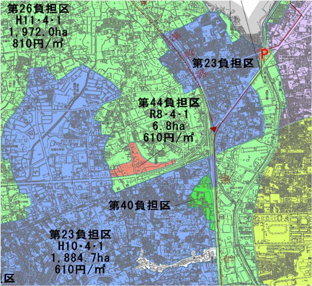
令和 8 年 4 月 1 日現在