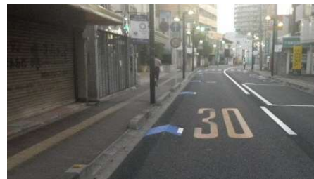
市内における自転車レーンの整備事例（左：自転車専用通行帯 右：矢羽根型路面標示）