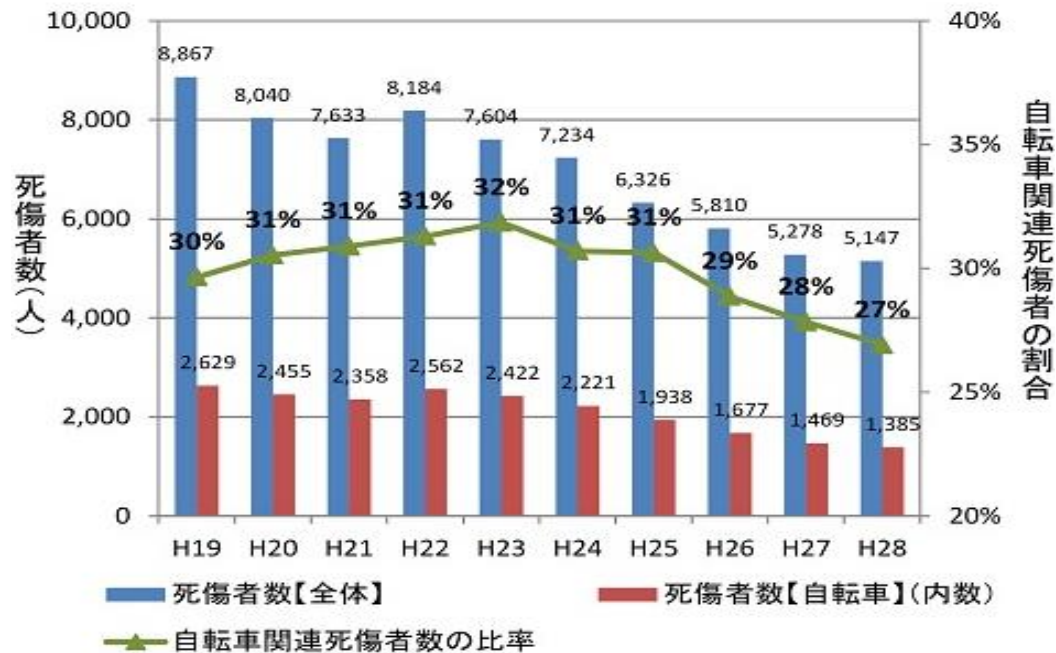
【市内の死傷者数の推移】