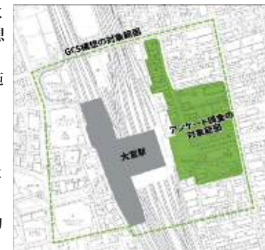
▲GCS構想と本調査の対象範囲

本アンケート調査の主旨をご理解の上、回答にご協力下さいますようよろしくお願いいたします。