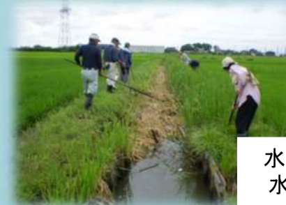
水路の草刈り、 水路の泥上げ