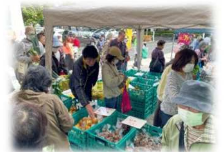
▲地産地消市・みぬマルシェ (見沼区役所)