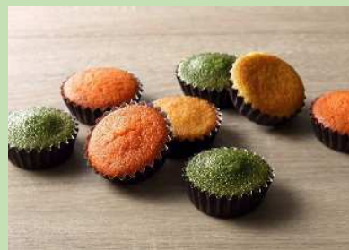
プチぷよ3食マフィン