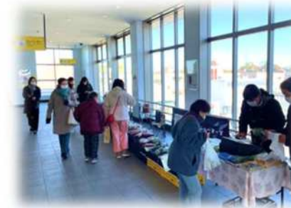
▲東岩槻農産物マルシェ (東岩槻駅構内)