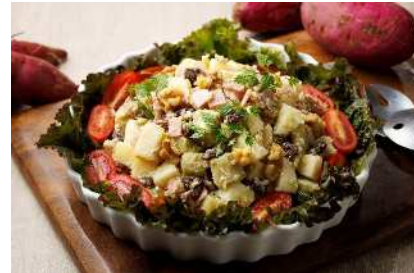
紅赤さつまいもと 青森りんごのサラダ