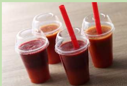
プチぷよスムージー