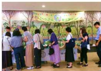
▲さいたま市役所 本庁舎