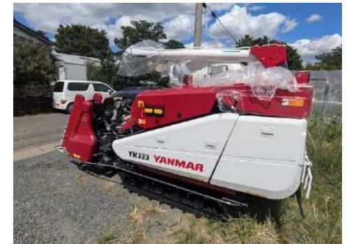
▶ R6導入 コンバイン