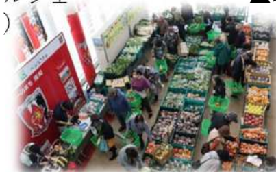
▲緑区プチマルシェ「緑(みど)ころ」(緑区役所)