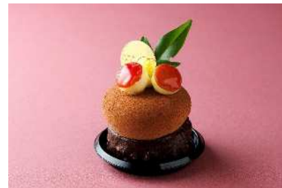
紅赤とりんごの ショコラムース