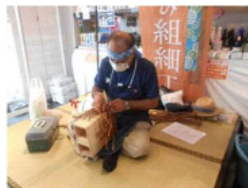
「奥会津編み組み細工」職人による実演