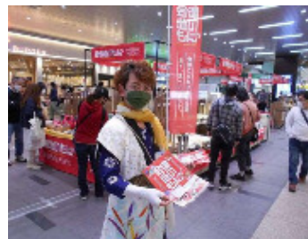
JR大宮駅での物産販売