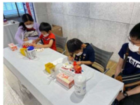
ワークショップ(あかべこの絵付け体験)