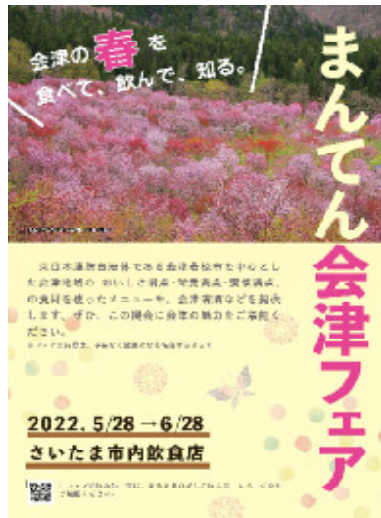
R4春のまんてん会津フェア チラシ