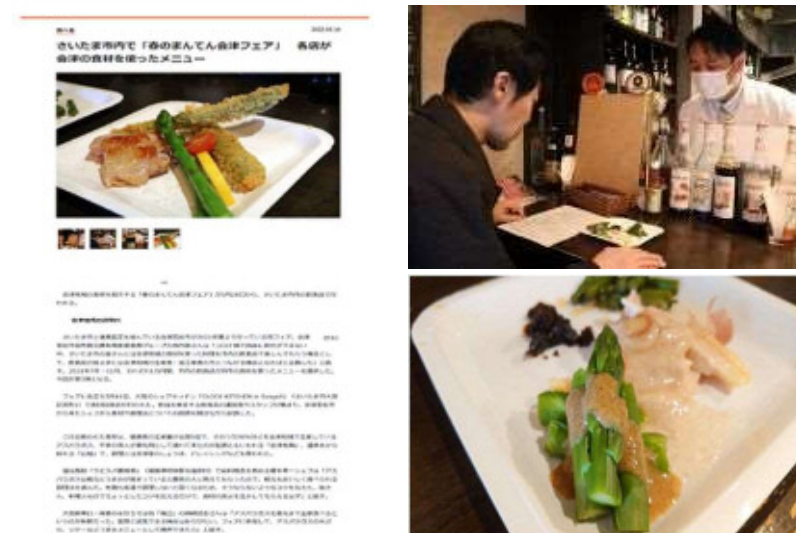
R4.5.19 大宮経済新聞記事掲載