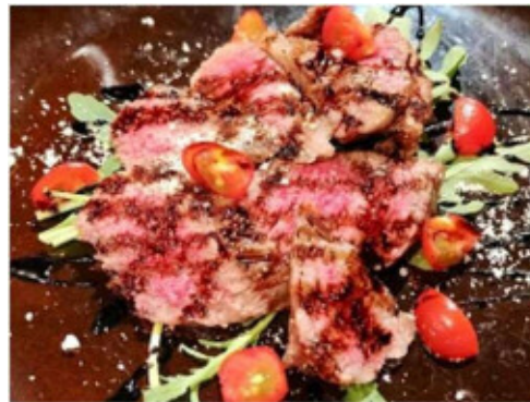
会津牛のグリル (ヴィーノテリア)