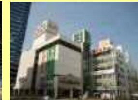
丸井・東急ハンズ・ダイエー