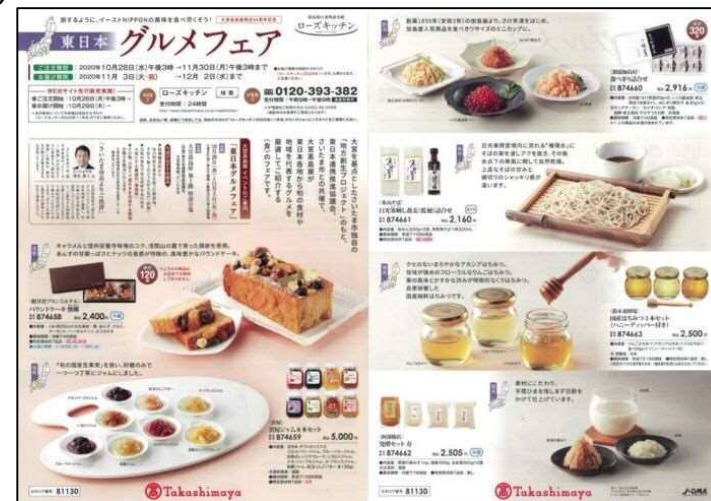
▲差し込みチラシ(A4表裏)