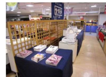
▲パンフレットコーナー