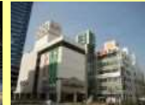
丸井・東急ハンズ・ダイエー