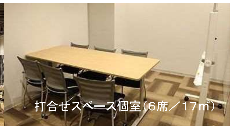
打合せスペース個室(6席/17㎡)

*詳細はHPからご確認できます https://marumaru-higashinihon.jp