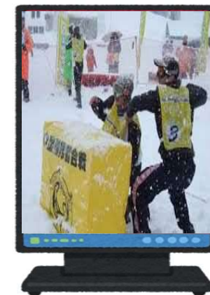
デジタルサイネージでの事業告知