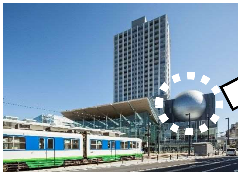
セーレンプラネット(自然史博物館分館)