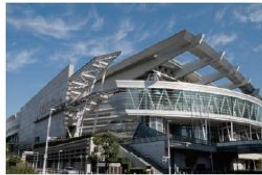
さいたまスーパーアリーナ