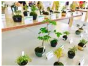
さいたま市が誇る盆栽