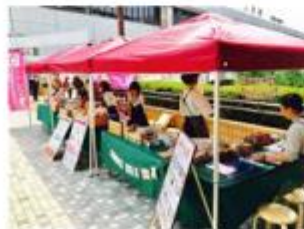
来年度はクラフトワーク拡大も