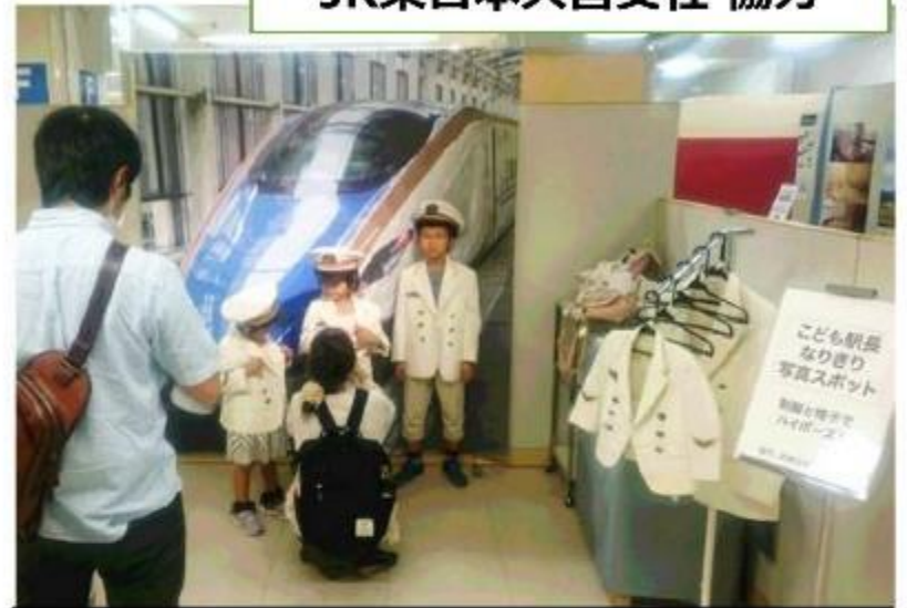
こども駅長 なりきり 写真スポット