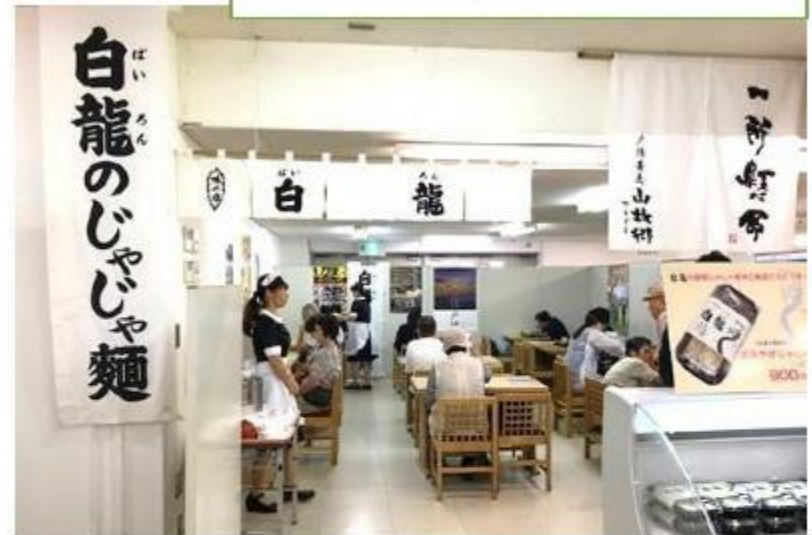
盛岡三大麺 じゃじゃめん 白龍(ばいろん)