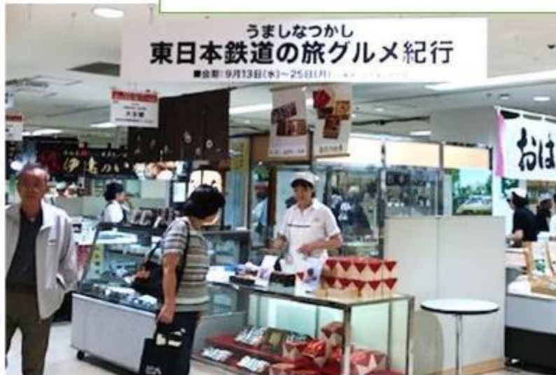
金沢の名店 大友楼 お弁当 復刻パッケージ