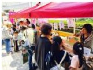
ファミリー層の来客も