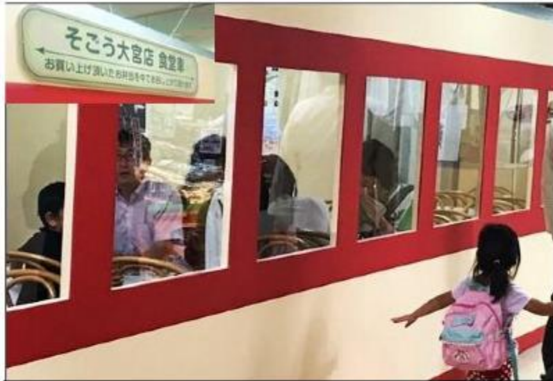
懐かしの食堂車を再現 親子に人気