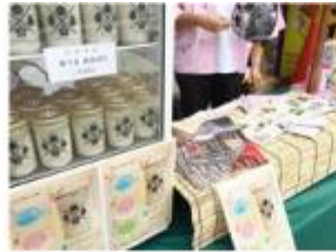
桜川市食べる甘酒