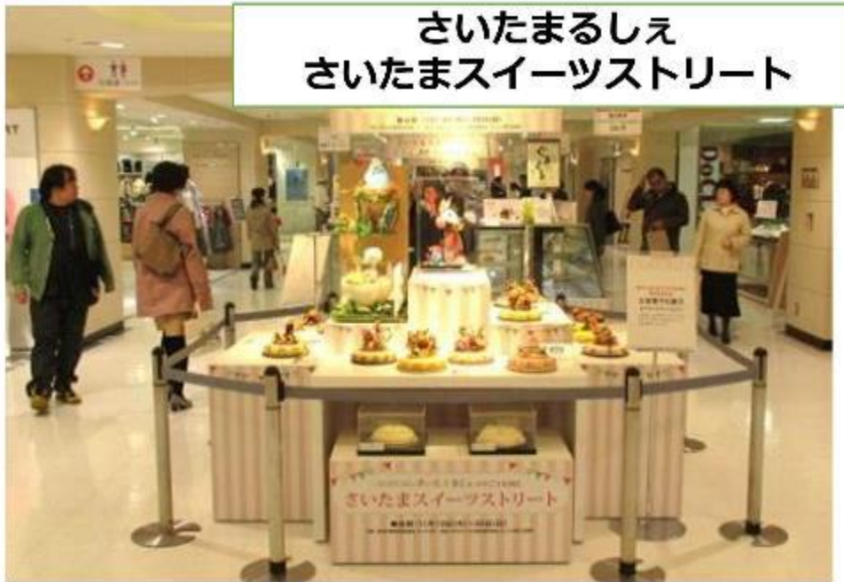
工芸菓子でお出迎え SNS拡散スポットに