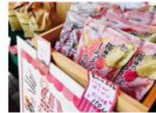
氷見市の白エビ煎餅