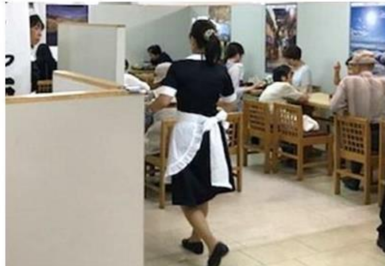
JR東日本協力・旧日本食堂の制服で給仕