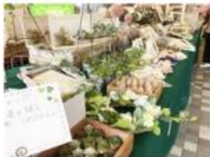
さいたま市クラフトワーク