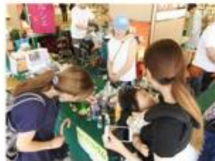
ワークショップも開催