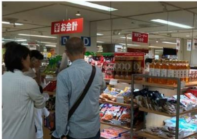
青森・秋田・石川・新潟のアンテナショップ