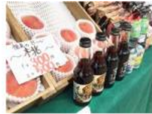
福島市桃がある、富山サイダー