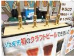
さいたま市クラフトビール