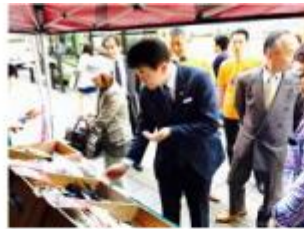
市長や幹部による視察