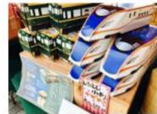
白エビ煎餅特製箱