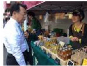
国会議員による視察