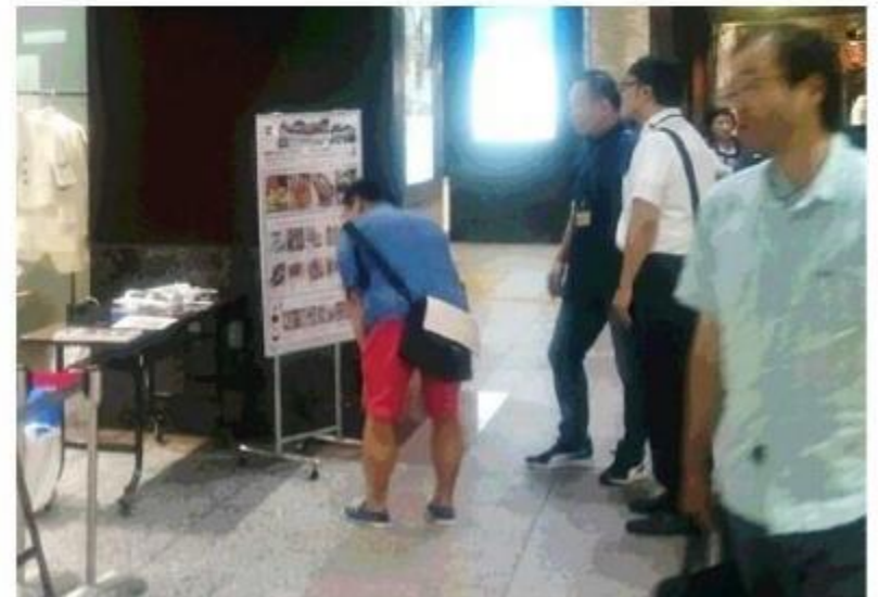
大宮駅コンコースでの催事告知 9