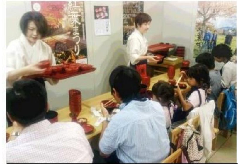
盛岡三大麺 わんこそば