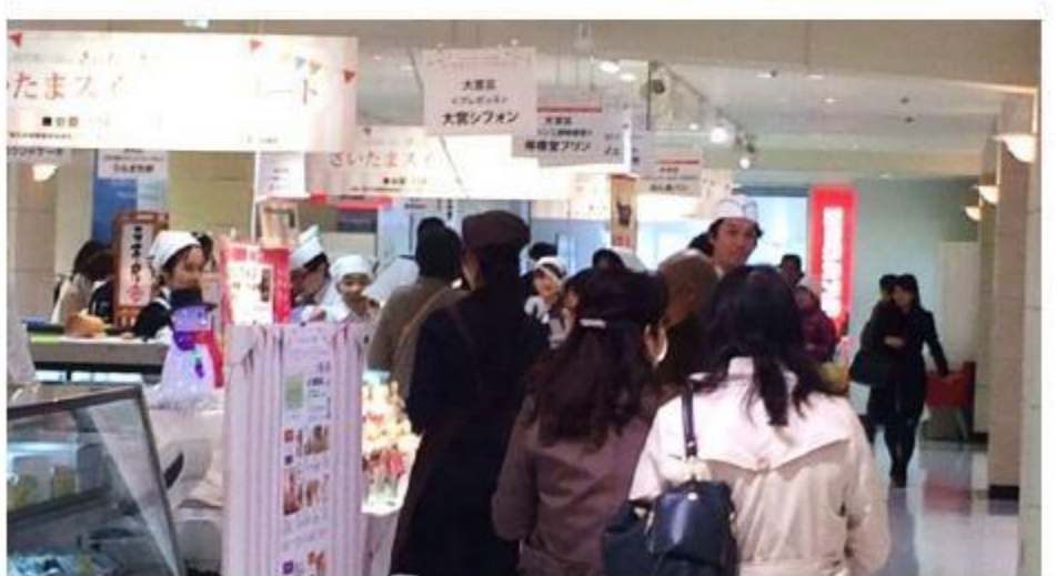
人気店には、長い行列が