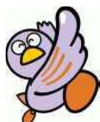
埼玉県のマスコット コバトン