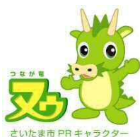
さいたま市PRキャラクター