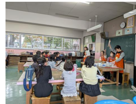
さいたま市立日進小学校・リサイクルを学ぼう

さいたま市と協働で環境学習を推進するため、「環境教育ネットワーク」に登録し、学校、公民館などの要請を受け、組合員（活動サポーター）が講師となり「リサイクル」や「食品ロス」「SDGs」について学べる「出前教室」を実施しています。