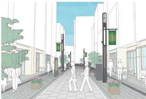
【一の宮通りの整備イメージ図】