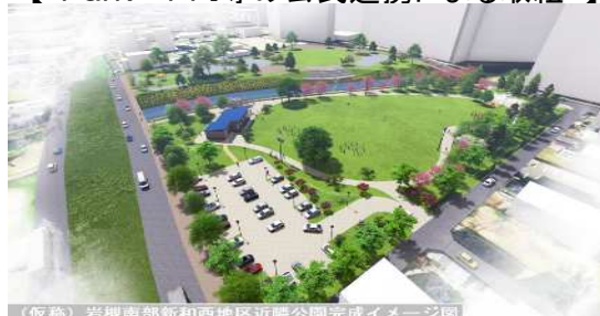
(仮称) 岩槻南部新和西区近隣公園完成イメージ図