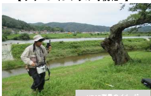
【グリーンインフラの可視化】

緑を通じて、災害から人々を守る強靱な都市空間を形成し、安全安心なまちに様々な都市機能が集積する