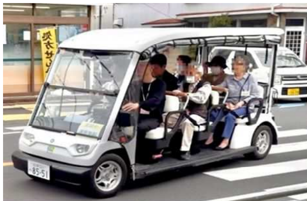
【時速20km未満で公道走行可能な電動車 『グリーンスローモビリティ』】