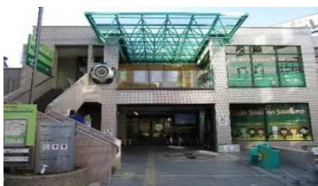
就労支援施設 「ワークステーションさいたま」

さらに、働きやすい環境づくりを推進するため、市内中小企業等に勤務する者の福祉向上を図る必要があります。