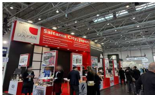
国際医療機器部品展示会 COMPAMED (ドイツ開催) さいたま市ブース