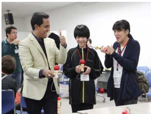
日本の文化的体験を通じた交流活動