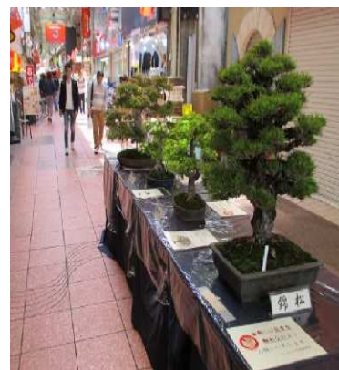
地域資源を活用した商業活性化事業

また、多彩な地域資源を生かした取組により市外からの来訪者を増加させ、交流人口の拡大による地域経済の活性化を図る必要があります。