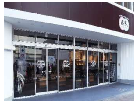
東日本連携センター (まるまるひがしにほん)

東日本の「ヒト・モノ・情報」が集まる「東日本連携センター（まるまるひがしにほん）」を拠点に、東日本地域との広域連携による効果的な情報発信と市内企業の取引拡大等を通じて、経済交流・市内経済活性化の更なる促進を図る必要があります。また、東日本の魅力を発信するハブ拠点としての機能を備えた地域経済活性化拠点を整備することで、市内外の交流を促し、本市と東日本地域の経済活性化につなげる必要があります。