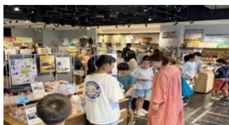
早期起業家教育事業における 商品販売会