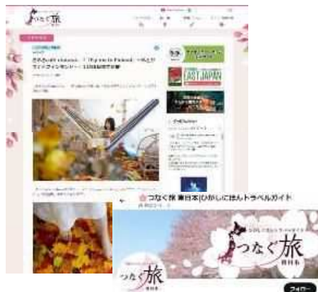
東日本連携都市の地域資源を紹介する Webサイト・SNS「つなぐ旅 - 東日本 -」

本市をはじめとする東日本連携都市への誘客を促進し、交流人口の拡大による地域経済の活性化を図るため、東日本地域の知名度向上、周遊促進に向け連携して取り組む必要があります。