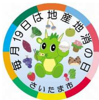
地産地消の日ロゴマーク 毎月19日は「地産地消の日」