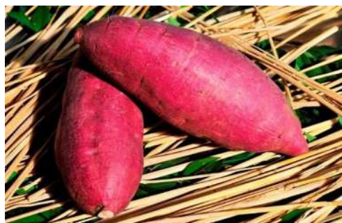
さいたま市発祥のさつまいも 「紅赤」

さらに、農産物の安全・安心な生産や環境と調和のとれた持続性の高い農業生産活動の支援を行うとともに、農情報の積極的な発信やブランド化により地産地消を推進する必要があります。