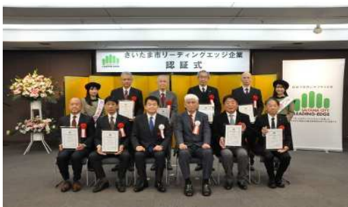
令和7年度 さいたま市リーディングエッジ企業 認証式

さらに、イノベーション創出による産業競争力強化のため、産学官金等の連携による高度人材の育成や新技術・新製品開発に向けた支援を行う必要があります。