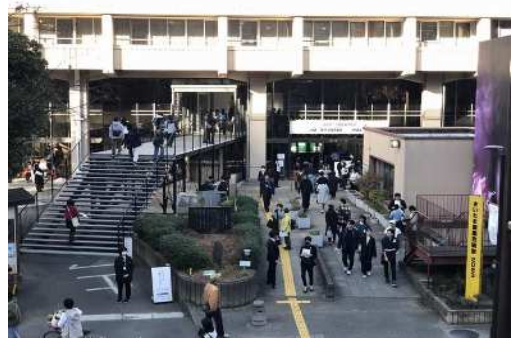
【さいたま国際芸術祭2023】

さらに、市民の多様化する文化芸術活動を支えるため、市民会館うらわ等の文化芸術創造拠点の整備を進める必要があります。