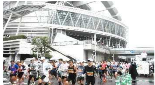
【さいたまマラソン】