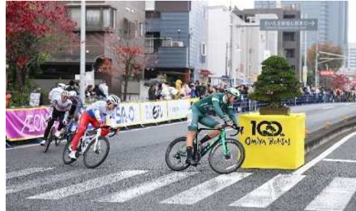
【2025 ツール・ド・フランスさいたまクリテリウム】

また、子どもから大人まで、初心者から上級者まで、多くの市民が楽しめるランニングイベントの開催や、「ツール・ド・フランス」の名を冠したレースの開催支援を行うことで、スポーツの振興はもとより、地域経済の活性化を図る必要があります。