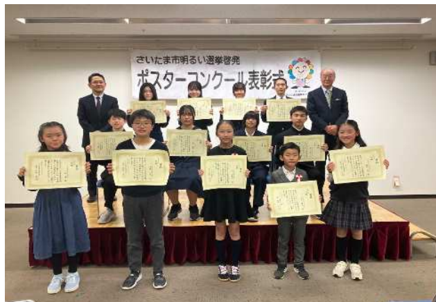
選挙啓発ポスターコンクール表彰式