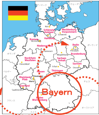
ドイツ・バイエルン州を中心とした欧州への展開

(さいたま企業の現状) 研究開発型ものづくり企業に求められているのは 高品質・高付加価値の技術による世界市場の開拓