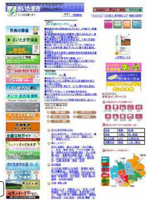
さいたま市ホームページ