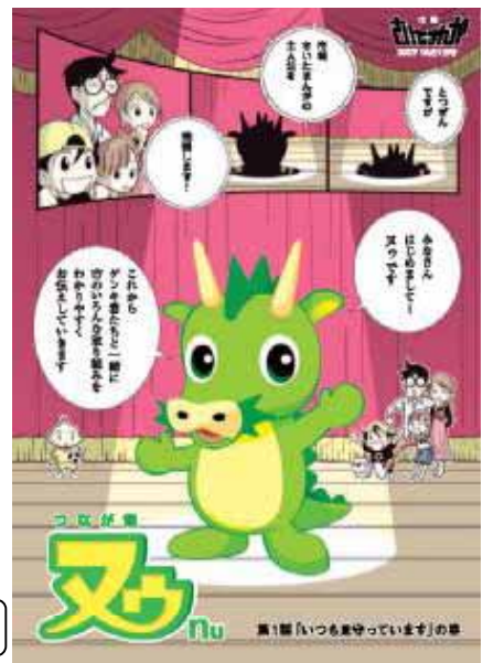
事業PRマガジン「さいたまんが」