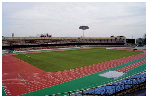
浦和駒場スタジアム

(4) 浦和レッズなどのスポーツ資源のほか、恵まれた伝統ある教育・文化資源を活用した、芸術・文化活動の振興が求められています。