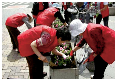
駅周辺での花の植栽

(1) 緑化意識の向上と、区民同士のふれあいや絆を深めることを目的とした、身近な場所での緑に出会う機会の創出が求められています。