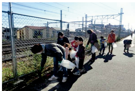
秋のごみゼロ運動

(7) 区民との協働による魅力あるまちづくりの推進が求められています。また、環境美化に対する区民意識が高い傾向にあります。