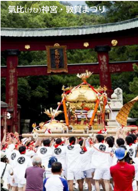
氣比(けの)神宮・敦賀まつり