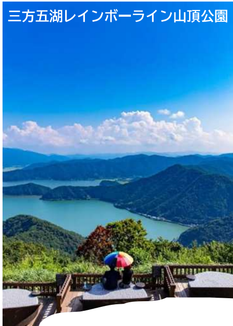
三方五湖レインボーライン山頂公園