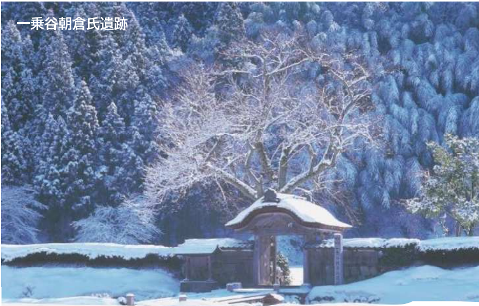
一乗谷朝倉氏遺跡