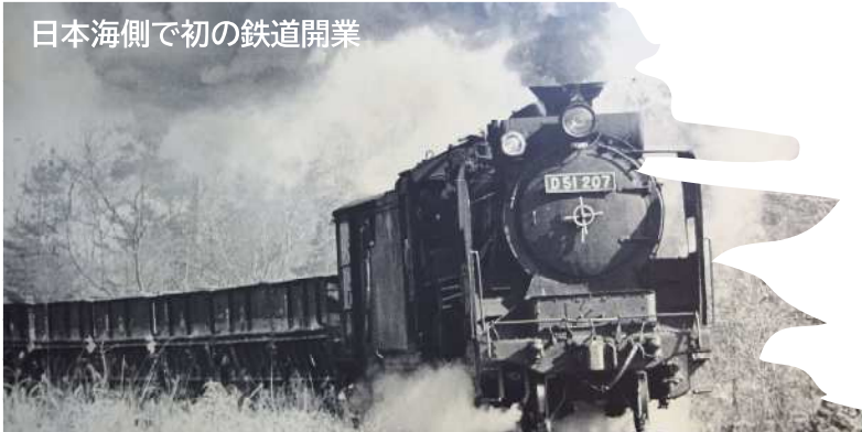
日本海側で初の鉄道開業