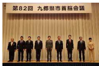
九都県市首脳会議 (R4.10.31)