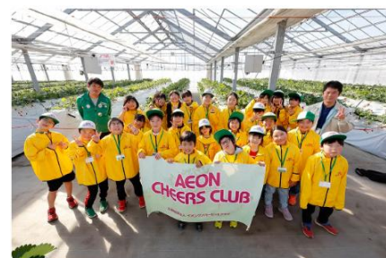
イオンチアーズクラブに所属するクラブ

小学生を中心に環境・社会について楽しく学び、考える力を育むクラブ「イオンチアーズクラブ」による活動を、全国のイオングループの店舗を拠点に展開されています。このクラブでは、「環境・社会」に関する体験学習を行っており、自然や地域の特色に触れ、仲間と様々な体験をしながら学ぶ場を提供されています。