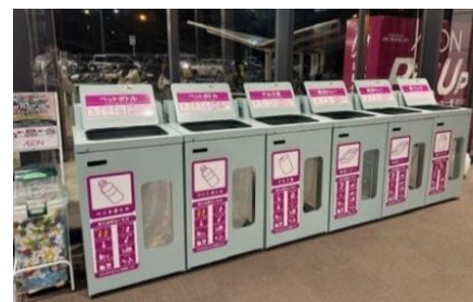
紙パック等の回収ボックス

また、貴重な資源を捨てずに再資源化するため、店頭で紙パック、食品トレー、アルミ缶、ペットボトル等の回収に取り組まれています。