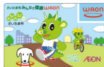
さいたま市みんな健康WAON

各地の自治体との連携のもと、ご当地WAONカードを発行し、カードの利用による収益の一部を各自治体に寄付していただくことで、地域活性化等に貢献されています。本市では、「さいたま市みんな健康WAON」を発行していただいております。本市への寄付金は、本市の健康増進とスポーツ振興に活用させていただいております。