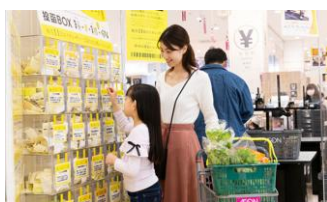
イオン幸せの黄色いレシート キャンペーンの様子

毎月11日の「イオン・デー」において、「イオン幸せの黄色いレシートキャンペーン」を実施されています。この取組により、レジ精算時に発行される黄色いレシートを、お客様が支援したい地域のボランティア団体名が記載されたボックスに投函していただくことで、レシート合計の1%分の品物をその団体に寄贈されています。