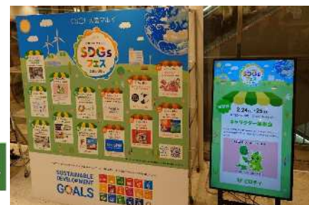
24年2月のSDGsフェスの様子

利用者はオンライン購入で発生する不要な梱包材の処理がその場で可能であり、店舗受取・発送を利用することで宅配事業者の配達・集荷の負担軽減にも寄与しています。