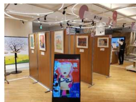
イベントスペースでの障がい者アート展

また、企業や団体と連携したイベントも数多く実施されています。これまでも、ウェルネスやエコロジーをテーマとして、テナントや地域の専門学校、東日本連携自治体などと連携したSDGsイベントを毎年開催されており、2月に行われた「SDGsフェス」には、北陸新幹線延伸開業を契機に本市と連携協定を締結した福井県や、CS・SDGsパートナーズ企業とともに本市も出展しました。