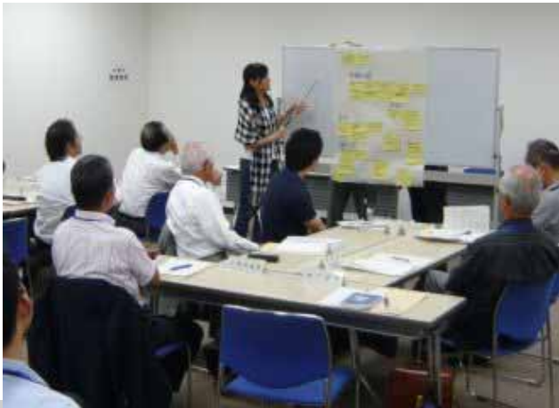
検討委員会の風景

さいたま市では、平成23年度末までの制定を目指し、「さいたま市自治基本条例検討委員会」において、「(仮称)さいたま市自治基本条例」の検討を行っています。委員会では、検討にあたり、市民のみなさん、議会、行政などと意見交換していきたくと考えています。