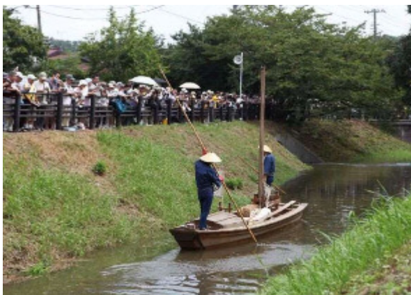
国指定史跡「見沼通船堀」の「閘門開閉実演」

そのためには、「いつでも、どこでも、何度でも」学べる環境と、人々が生きがいを持って社会に参加し、地域コミュニティの維持・活性化へ貢献できる仕組みを整えていくことが重要です。