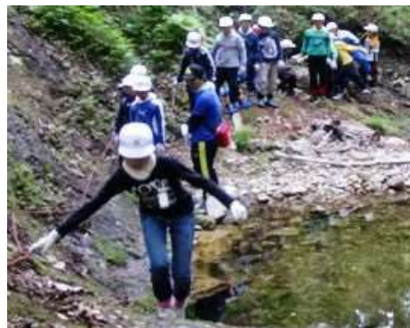
館岩少年自然の家（福島県南会津町）での自然体験活動（源流探検）