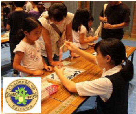
「自分発見！」チャレンジup さいたま

また、学校と地域が連携・協働して未来を担う子どもたちをはぐくむためには、地域が学校を育て、学校が地域を育てる「学校を核とした地域づくり」を構築し、潜在している地域の教育力を学校に呼び込むことが必要です。