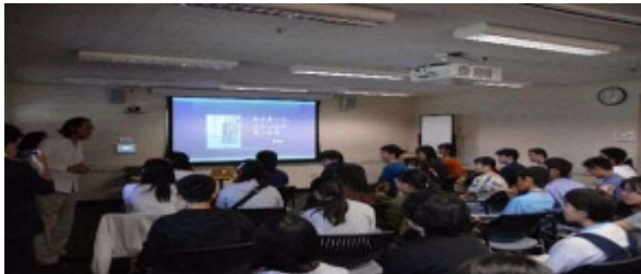
「最先端イノベーションプログラム」事業の実施 ～アメリカ合衆国 スタンフォード大学～

経済活動が地球規模に広がり、インターネットを通じたコミュニケーションが広く普及した現在、グローバル化が一層進展し、情報通信や交通分野での技術革新により、社会のあらゆる分野でのつながりが国境を越えて活性化しています。また、地球規模の人類共通の課題が増大している中、多様性を理解し、言語や文化が異なる人々と交流するために必要な力を育成することが重要です。そのためには多世代交流や異年齢交流等、様々な体験を通じて学びに向かう姿勢や自己肯定感・自己有用感、豊かな情操や道徳心等、豊かな人間性を培う必要があります。