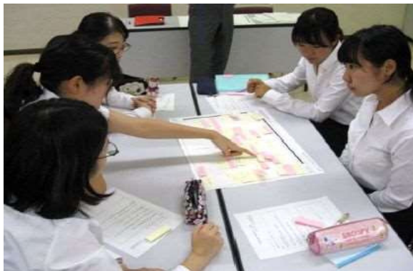
将来のさいたま市で活躍する教員を養成することを 目指す「教員養成あすなろプロジェクト」の実施

また、子ども自身に危険を回避する能力をはぐくむ安全教育を推進するとともに、老朽化している学校施設に対して計画的、総合的な対策を実施し、施設の長寿命化を図り、着実に教育環境を整備していくことが重要です。