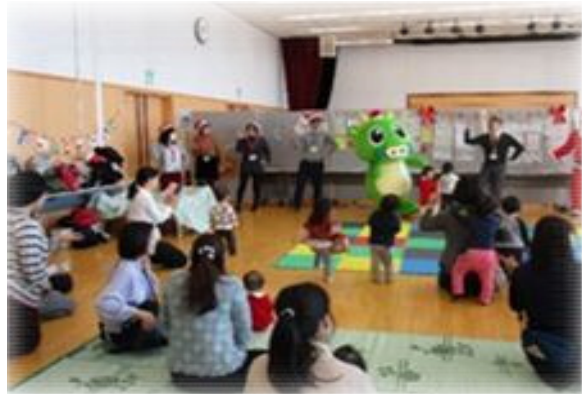
公民館での子育てサロン はあとくらぶ