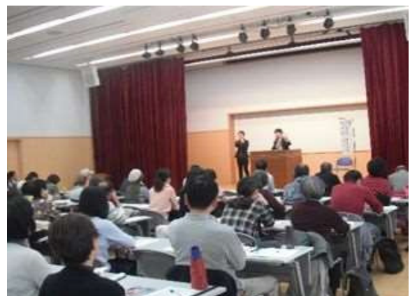
さいたま市民大学事業の推進