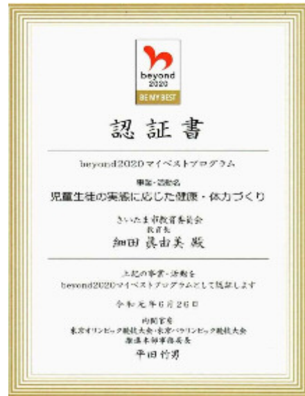
『beyond2020マイベストプログラム』認証 (児童生徒の健康・体力づくり)