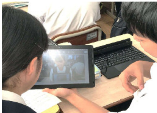
タブレット型コンピュータの配置等によるICTを活用したアクティブ・ラーニングの推進

現在は、第4次産業革命の時代と呼ばれ、技術の革新によってあらゆるものがインターネットにつながり、情報やデータがリアルタイムで交換・蓄積されるようになりました。こうして得たビッグデータを人工知能（AI）が解析し適切な制御を行うことで、生産性の向上が図られる一方、従来人手で行われていた仕事の多くがAIやロボット等によって代替され始めています。このような新しい時代において、生きて働く知識・技能を習得し、人間ならではの感性に基づいた思考力や判断力、表現力を身に付け、自身の学びを人生や社会に生かそうとする意欲や力、人間性を涵養していく必要があります。