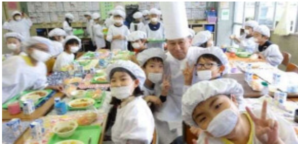
「地元シェフ」による地場産物を活用した学校給食