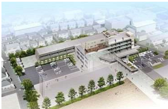
与野本町小学校複合施設整備事業の推進