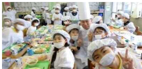
「地元シェフ」による 地場産物を活用した 学校給食