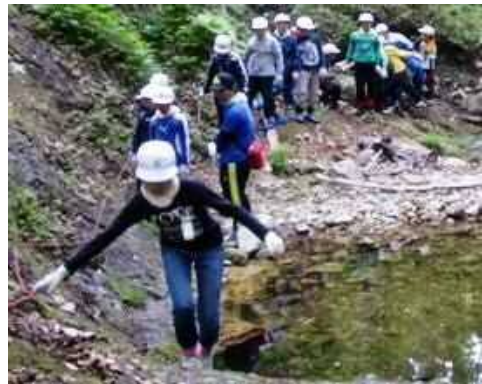
館岩少年自然の家（福島県南会津町） での自然体験活動（源流探検）