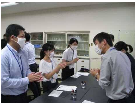
教員のコミュニケーション力等を向上させるための研修