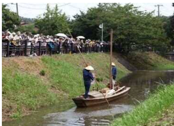
国指定史跡「見沼通船堀」の「閘門開閉実演」

そのためには、全ての人が生きがいを持ち、生涯にわたって質の高い学びを続けられる環境と、人生を豊かに生きるために、学んだことを生かして活躍できる環境を整えていくことが重要です。そのため、コロナ禍においても、感染症対策を講じつつ生涯学習関連施設で実施する対面の講座と、学習資源をパッケージ化しウェブサイトで配信する「e公民館」や「学びの玉手箱」などのデジタルコンテンツとのハイブリッド型の生涯学習環境を整備してまいります。