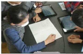
I C Tを活用した アクティブ・ラーニング (タブレット型コンピュータ)

さらに、コロナ禍において「G I G Aスクール構想」の実現が加速したことを受け、I C Tを活用したアクティブ・ラーニングの推進や、I C Tを活用した自律的な個別最適化した学びの融合など「I C Tを活用した学びの改革」を進める必要があります。また、感染症対策により人と人との接触が制限される今だからこそ、子どもたちの豊かな人間性をはぐくむため、自然体験活動のより一層の推進が求められています。