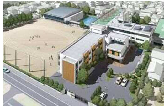
学校施設リフレッシュ推進事業 (大戸小学校)