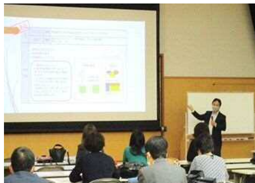
さいたま市民大学事業の推進