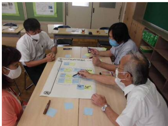
学校運営協議会での熟議

そのために、学校と地域が連携・協働して未来を担う子どもたちをはぐくむコミュニティ・スクールを推進します。また、地域の多様な教育資源を活用し、地域コミュニティの活性化と、地域発展の担い手となる人材を育成します。