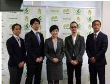
さいたま市 G I G Aスクール 構想推進本部会発足式