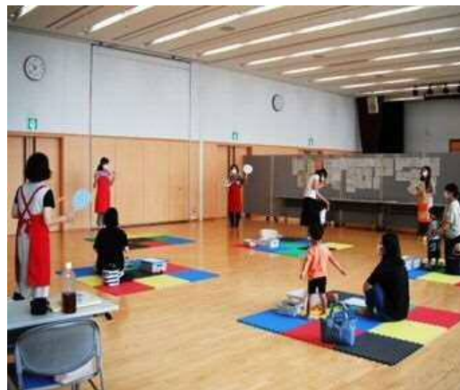
公民館での子育てサロン はあとくらぶ