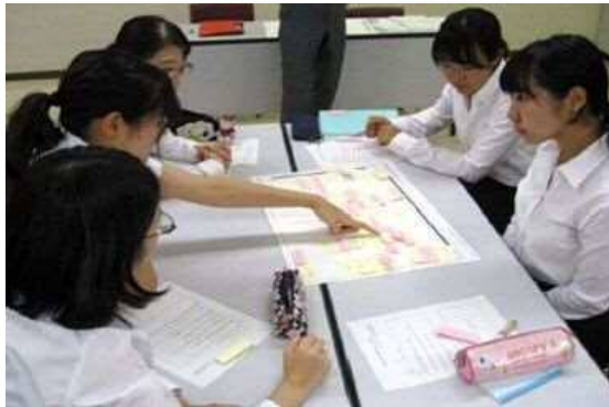
将来のさいたま市で活躍する教員の養成を目指す「教員養成あすなるプロジェクト」の実施

また、子ども自身に危険を回避する能力をはぐくむ安全教育を推進するとともに、老朽化している学校施設に対して計画的、総合的な対策を行い、施設の長寿命化を図ることで、安全・安心で質の高い教育環境を整備し、学校安全体制を推進していくことが重要です。