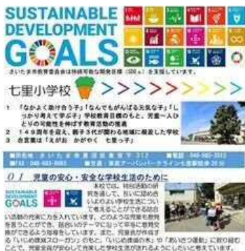
学校教育におけるS D G sの取組の推進 ～P Rシート～

また、地球規模での人口増加や経済規模の拡大の中で、人間活動に伴う地球環境への負荷はますます増大していることから、持続可能な社会の創り手を育成するため、S D G sの実現を目指した教育を推進する必要があります。