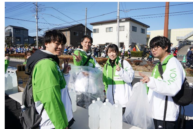
前大会の写真です。