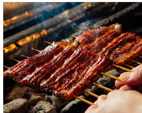
前大会の写真です。