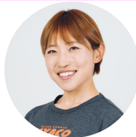
ウルトラランナー みゃこさん