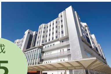
さいたま市立病院