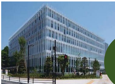
大宮区役所区民課 北部市税事務所市税の総合窓口