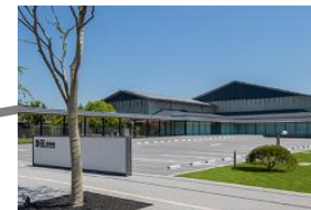
宇宙のまち さいたま さいたま市青少年宇宙科学館