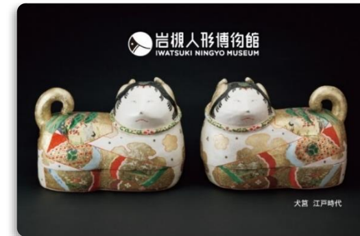
岩槻人形博物館年間パスポート