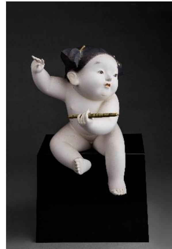
野口光彦「童心戯笛」(1956)当館蔵