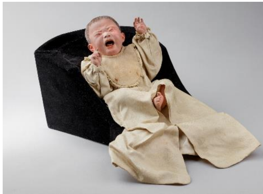
平田郷陽「泣く子」(1936)個人蔵