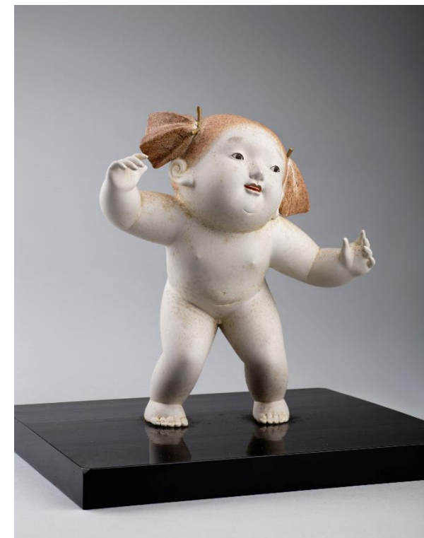
野口光彦「陽炎」(昭和時代)当館蔵