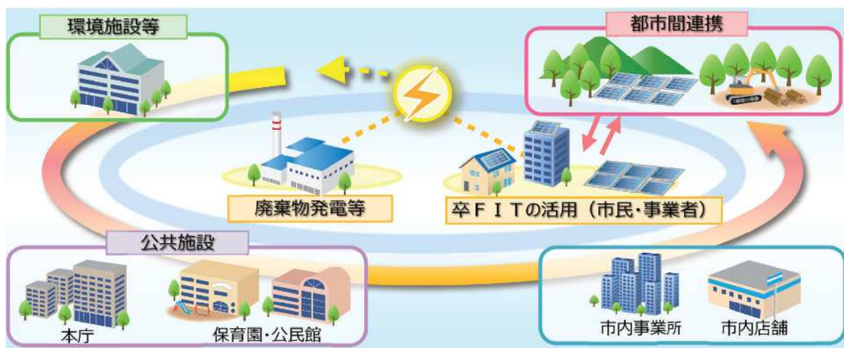
図46 事業のイメージ