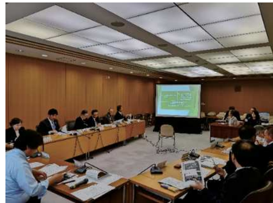
図49 さいたま市地球温暖化対策地域協議会の全体会議