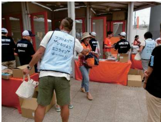
図48 普及啓発の様子