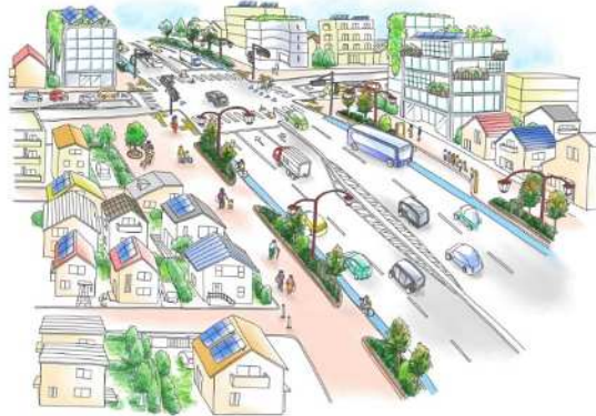
都市の機能強化を図る道路