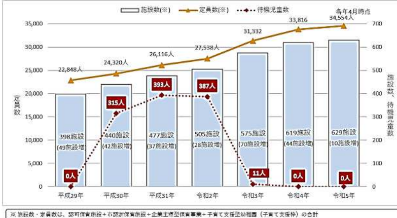
【認可保育所等の施設数、定員数、待機児童数の推移（各年4月現在）】