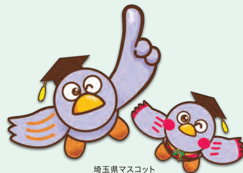
埼玉県マスコット 「コバトン」 「さいたまっち」

奨学金返還支援を行った企業負担額の1/2(上限1人・年9万円) 埼玉県多様な働き方実践企業については、企業負担額の2/3(上限1人・年12万円) ※埼玉県多様な働き方実践企業とは、仕事と家庭の両立を支援するため、テレワークや短時間労働など、多様な働き方を実践している企業等を県が認定する制度