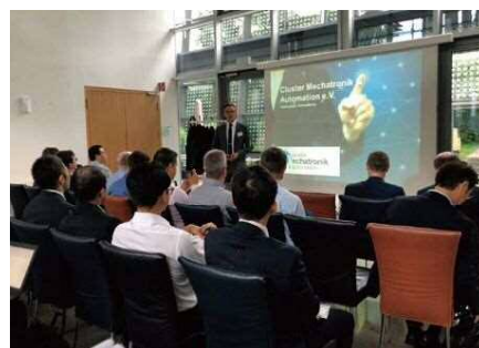
グローバル人材育成プログラム