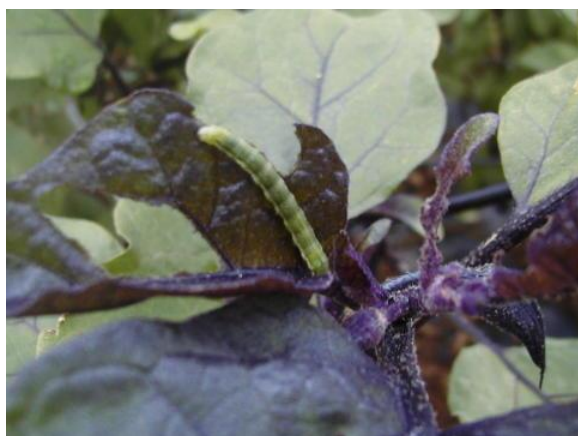
写真1 オオタバコガ幼虫による葉の食害