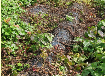
地上部の生育不良・枯死